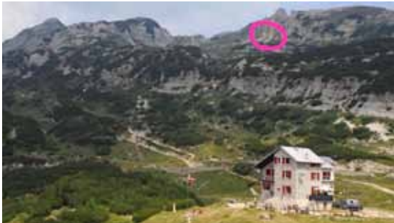
Foto qui sopra la frana, a lato la delibera del Comune di Ala (Tn)

ATTENZIONE! Causa frana il tratto da Bocchetta Fondi al Rifugio Pompeo Scalorbi del Sentiero Europeo E5 (segnavia CAI 109) è momentaneamente chiuso, sono stati approntati e segnalati dei sentieri alternativi in sicurezza .